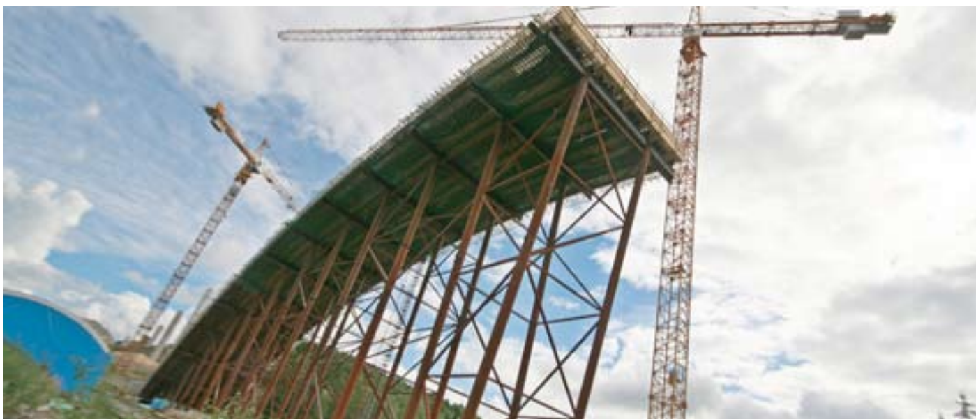
Motorvägsbroar Yttre Ringvägen, Trafikplats Petersborg, Malmö Uppdragsgivare: SVEDAB